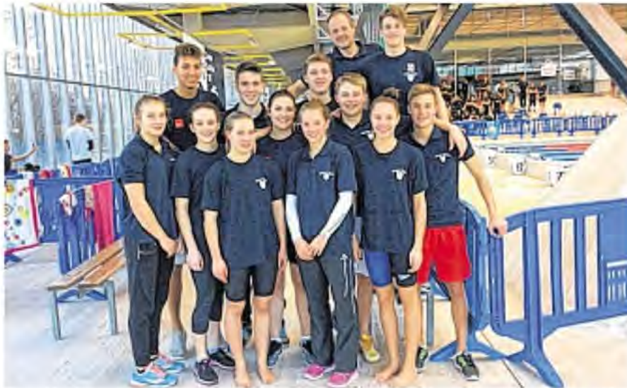
Der Kader des Tiroler Landesschwimmverbands: Die Wassersportler strahlten nach ihren insgesamt sieben Rekorden.