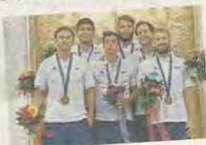
Die erfolgreichen Tiroler Team-Wasserballer.

lipp Perisutti und Bernhard Hengl gab es Gruppensiege über Indonesien (12:6), Tunesien (16:9), Guatemala (20:3), ehe man gegen den Iran (8:12) den Kürzeren zog. Im Spiel um Platz drei zwang man Malta in die Knie.