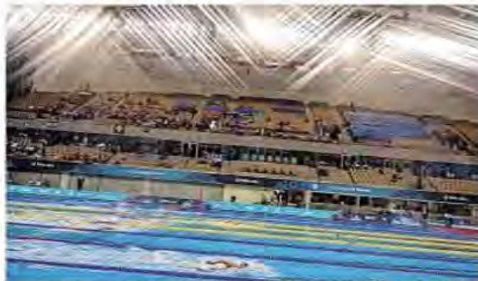
Noch glänzte es in der Schwimmhalle nicht für Österreich.