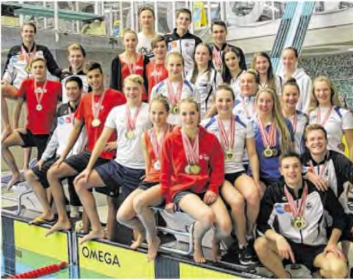
Von Graz ins Höttinger Bad: Tirols Abordnung; bei den Staatsmeisterschaften dekoriert mit 48 Medaillen in den Junioren- und allgemeinen Bewerben (elf Landesrekorde und zehn in den Nachwuchsklassen).