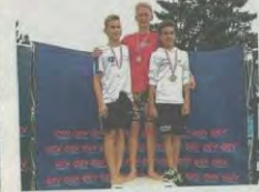
Gleich drei Mal durfte das Schwimm Talent die Goldmedaille entgegennehmen.