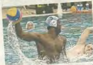
Stark: WBC Tirol siegte mit 26:4 gegen IWV Wien.

klar durch. „Wir haben schon lange nicht mehr so eine Abfuhr kassiert“, soll so mancher Wiener gemeint haben. Das Finale Salzburg gegen Graz wurde wegen einer Attacke auf den Schiedsrichter abgebrochen. (TT)