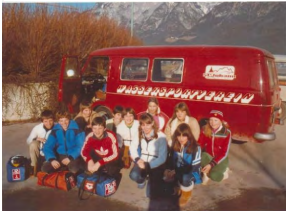
Mannschaft beim Westcup 1979 mit dem ersten Vereinsbus !