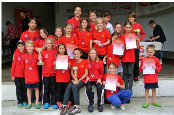
Grosse Beteiligung beim beliebten TIGAS Cup