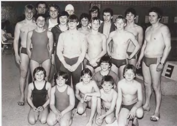
Erstes Mannschaftsfoto Vergleichswettkampf in Innsbruck 1975

Einen runden Geburtstag feierte heuer der Wassersportverein St.Johann. Auf erfolgreiche 40 Jahren Schwimmsport kann der Verein nunmehr zurückblicken . Im März 1975 traf sich eine kleine Gruppe Schwimmbegeisterter und hob den Verein aus der Taufe und bereits im selben Jahr fanden die ersten Vergleichswettkämpfe statt. Sehr bald stellte der WSV eine fixe Grösse im Tiroler Schwimmsport und in der örtlichen Sportszene dar.